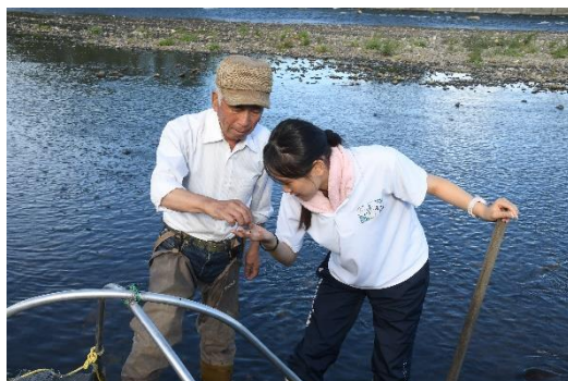
名人を訪問し、一対一で話を聞く