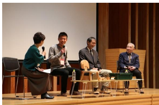
来年3月には、都内で成果発表会を開催