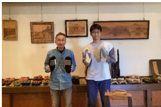
名人は造林手、木工職人、漁師などさまざま