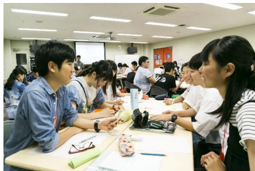
夏の事前研修では「聞き書き」の手法について学ぶ

(プロフィール)東京農業大学大学院修了。JICA専門家としてパラグアイに赴任。帰国後、長崎オランダ村、ハウステンボスの企画、運営に携わる。現在は(特非)共存の森ネットワーク理事長として、日本やアジア各国の地域づくり、人づくりを実践中。明治の大実業家、洪澤栄一の曾孫にあたる。